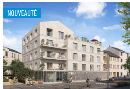
BRICK LANE > Du 2 au 5 pièces*