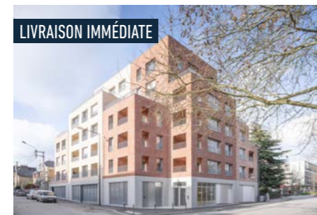
KALIA > Derniers 3 et 5 pièces*