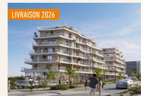
SPIKY > Du 3 au 5 pièces*