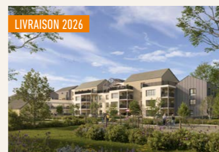
TERRASILVA > Du 3 au 4 pièces*