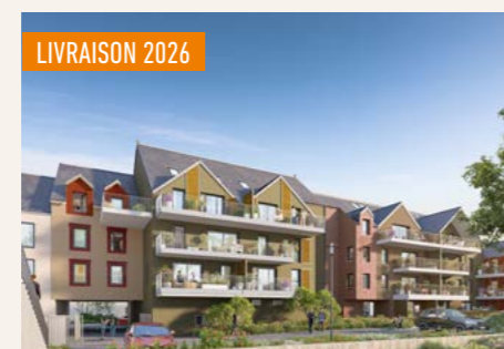
EXCELSIOR > Du 2 au 5 pièces*