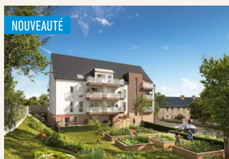
LES JARDINS DU PRESBYTÈRE > Du 2 au 3 pièces*