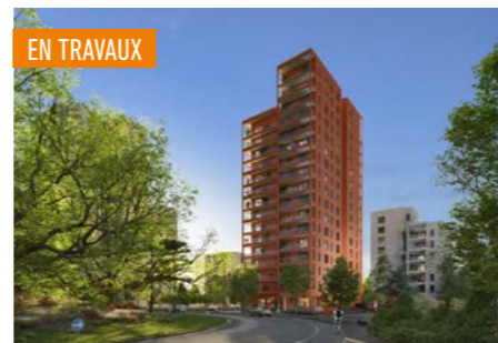
RED LINE > Du 2 au 4 pièces*