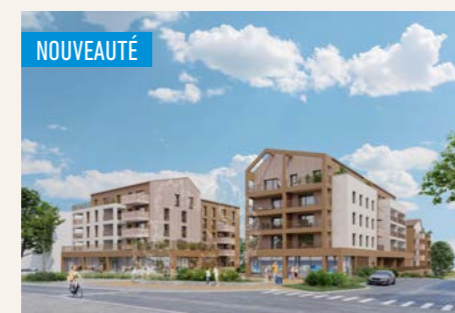
LE CLOS DES SENS > Du 2 au 4 pièces*