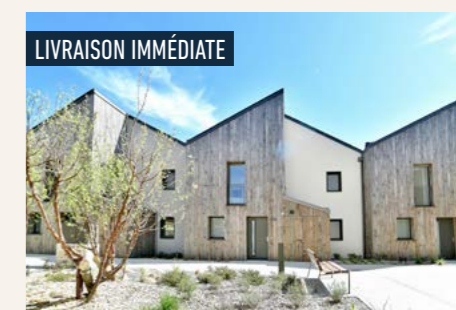
EKO LODGE > Maisons 5 pièces*