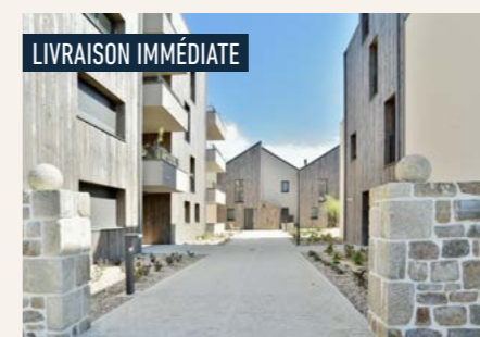
EKO LODGE > Derniers 3, 4 et 5 pièces*