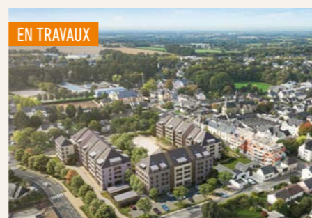
AN DISKUIZ > Du 2 au 5 pièces*