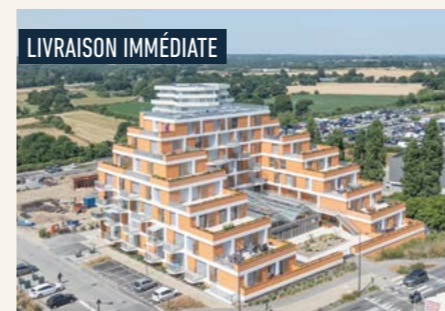
HAPPY > Derniers 3 et 4 pièces !