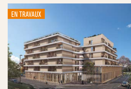
CITY'ZEN > Du studio au 2 pièces*