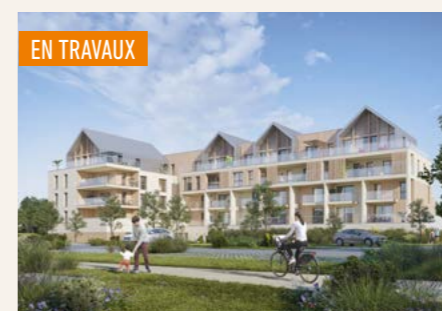
PANORAMA > Du 2 au 5 pièces*