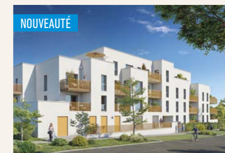
TERRASSES DES GLÉNAN > Du 2 au 3 pièces*