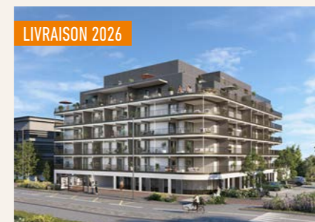
HOLY > Du 4 au 5 pièces*