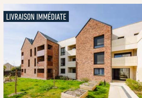
BRICK LODGE > Dernier 3 pièces !*