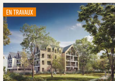
JARDIN SECRET > Du studio au 3 pièces*