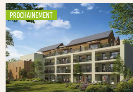
ARBORIS > Du 2 au 4 pièces*